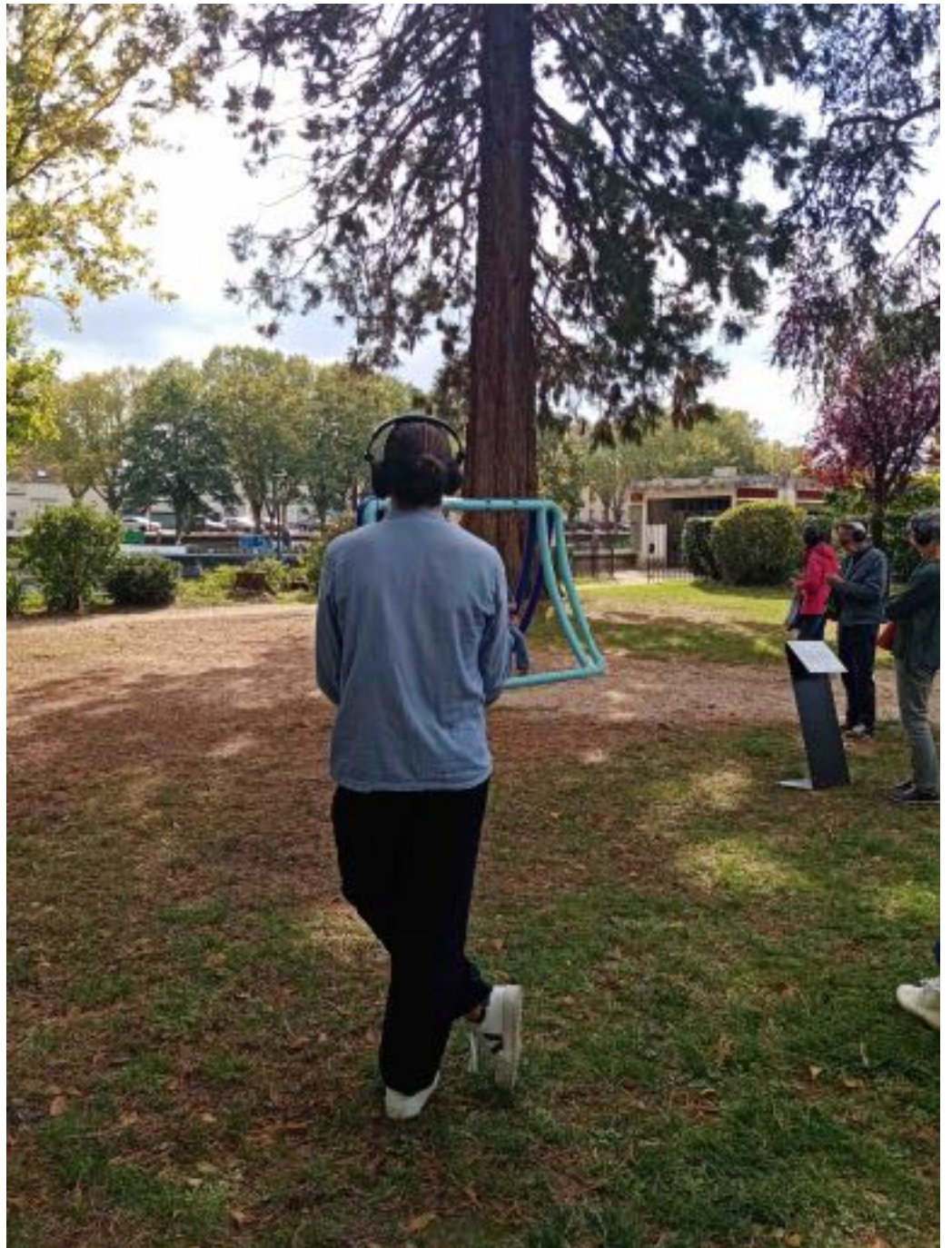
Vue d'un participant en train d'écouter la piste « les demoiselles », Vivante, Vierzon, 2022