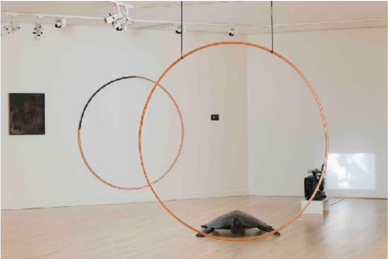
AL Sacriste, vue d'expo, Musée Marmottan 2024