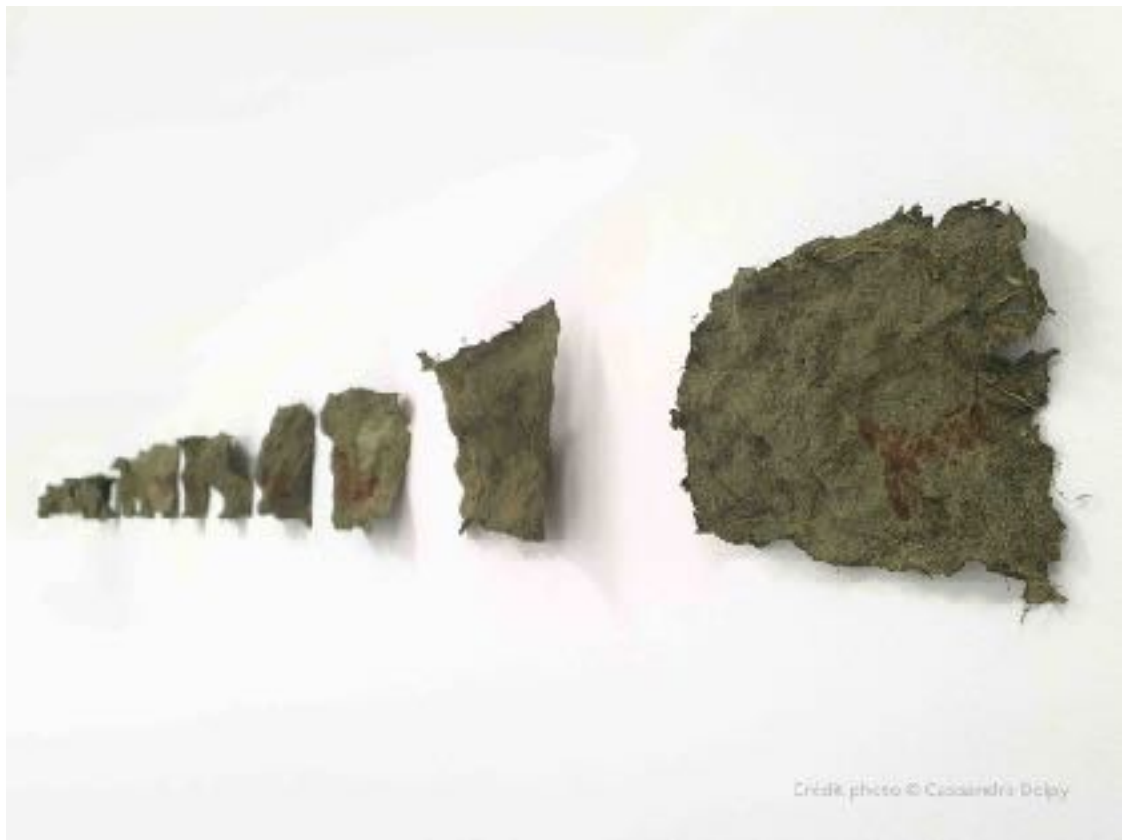
Urtica,, pyrogravure sur papier d'ortie

En explorant la matière et les différents dispositifs permettant la création de l'image photographique et cinématographique, son travail repose sur l'étude du vivant dans un cadre à la fois spatial et temporel dans un déplacement constant entre microcosme et macrocosme. Questionnant les images et les outils du passé afin de les réactualiser dans le présent, son travail consiste à réinventer des procédés et instruments pour créer de nouvelles représentations.