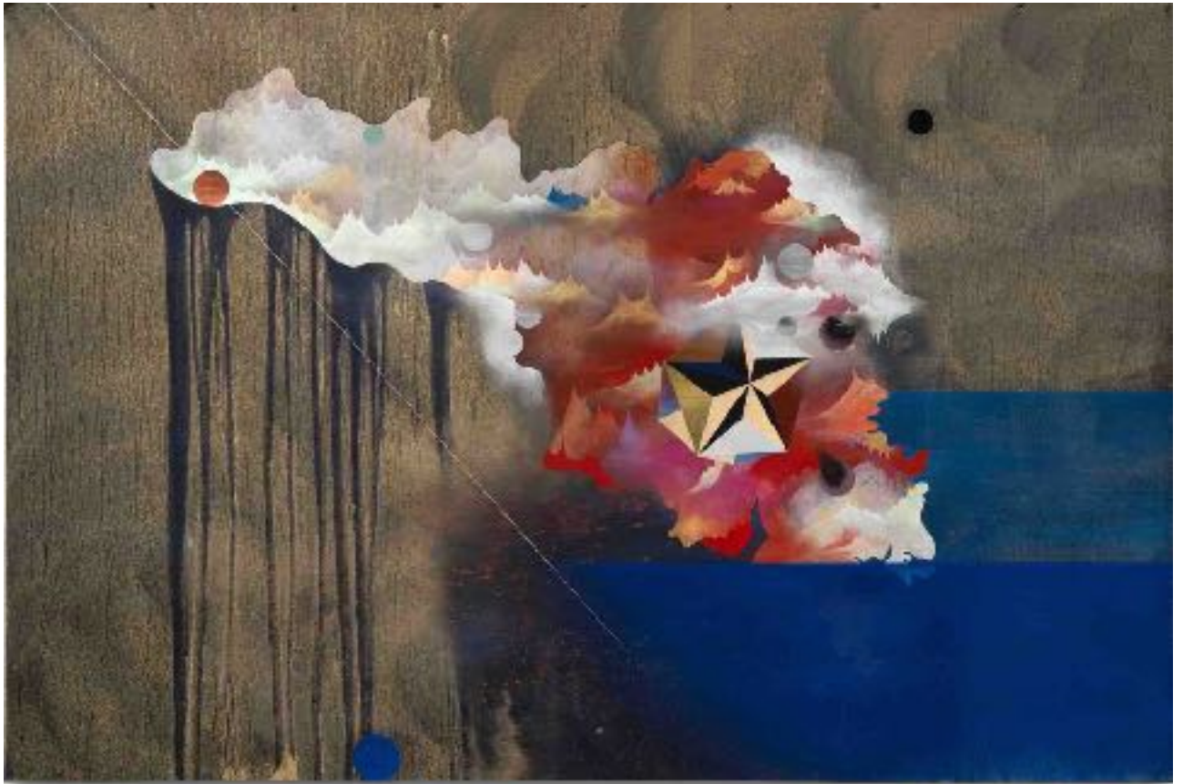
Les cimes de la cataracte, Paul Mignard 2023, pigments sur toile libre, 150 x 225 cm