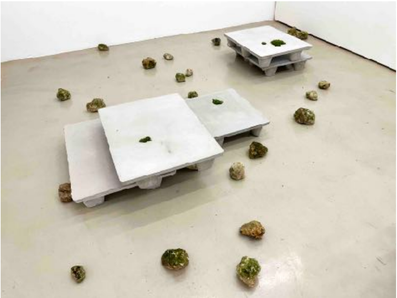
Et puis, ... , Bernard Calet 2024, béton, bryophytes, cailloux Galerie Fernand Léger Ivry-sur-seine ©Bernard Calet